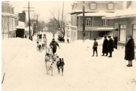
Course de traîneaux à chiens sur la 1 ère Avenue en 1927

Cette exposition présentera un florilège de photos anciennes de Charlesbourg et de Beauport à différentes époques. Elles montreront que nos ancêtres savaient s'occuper en hiver comme en été et que la pratique des sports est inscrite dans l'ADN des Québécois depuis belle lurette. Cette exposition est une collaboration de la SHC avec les arrondissements de Beauport et de Charlesbourg dans le cadre de l'Entente de développement culturelle intervenue entre la Ville de Québec et le ministère de la Culture et des Communications du Québec.