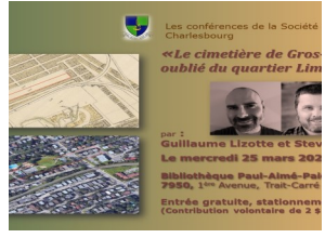
Conférence sur le cimetière de Gros-Pin