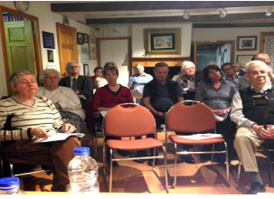
Assemblée générale annuelle